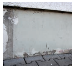
Waagerechte Fläche (Terrasse)