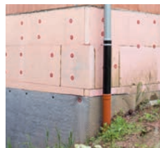
Mauerwerk (Sockel gedämmt)